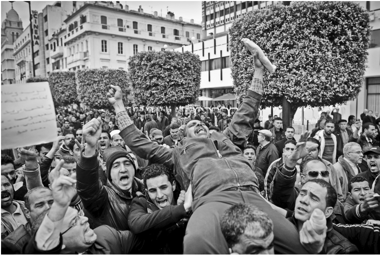
3 Das Baguette als Protestsymbol: Demonstration in Tunis am 18. Januar 2011.

werken im Süden des Landes legten spontan die Arbeit nieder. Bourguiba schickte die Armee, mehr als 500 Menschen wurden getötet. Die Erhöhung der Brotpreise aber musste er zurücknehmen.