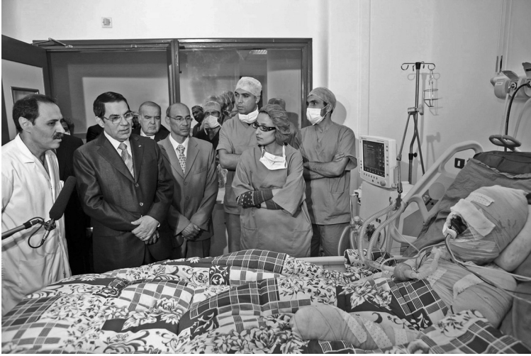
2 Ben Ali am Krankbett von Mohammed Bouazizi, 4. Januar 2011.