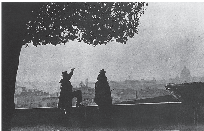
Abb. I: Paul Klee (l.) und Hermann Haller im Garten der Villa Borghese, Rom, Februar 1902